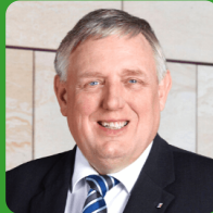
Karl-Josef Laumann, MdL Minister für Arbeit, Gesundheit und Soziales des Landes NRW