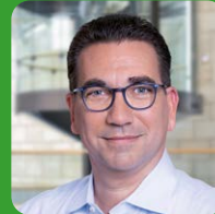
Guido Déus Oberbürgermeister der Stadt Bonn