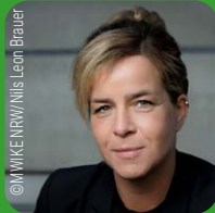
Mona Neubaur, MdL Ministerin für Wirtschaft, Industrie, Klimaschutz und Energie des Landes NRW