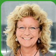
Beate Müller-Gemmeke Sprecherin von GewerkschaftsGrün, Bündnis 90/Die Grünen