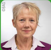
Inken Gallner Präsidentin des Bundesarbeitsgerichts