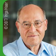
Dr. Gregor Gysi, MdB Die Linke