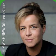
Mona Neubaur, MdB Ministerin für Wirtschaft, Industrie, Klimaschutz und Energie des Landes NRW