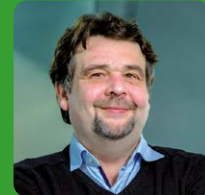
Dennis Radtke MdB – CDA-Vorsitzender CDU