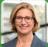
Anke Rehlinger Ministerpräsidentin des Saarlandes, Landesregierung Saarland