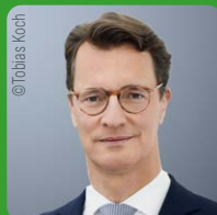
Hendrik Wüst MdL Ministerpräsident NRW: Land NRW