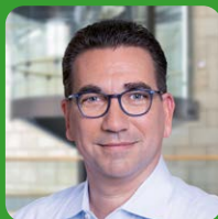
Guido Déus Oberbürgermeister der Stadt Bonn