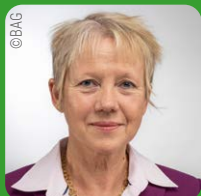
Inken Gallner Präsidentin des Bundesarbeitsgerichts