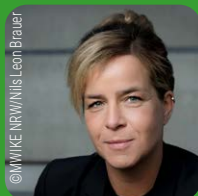
Mona Neubaur, MdL Ministerin für Wirtschaft, Industrie, Klimaschutz und Energie des Landes NRW