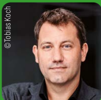
Lars Klingbeil MdB Vizekanzler / Finanzminister